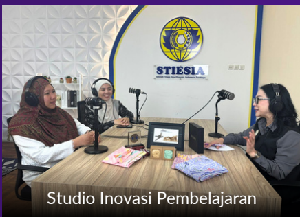
Studio Inovasi Pembelajaran