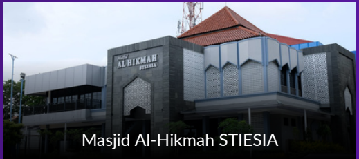
Masjid Al-Hikmah STIESIA