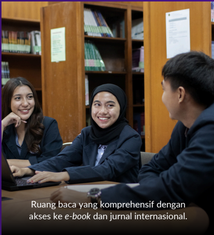
Ruang baca yang komprehensif dengan akses ke e-book dan jurnal internasional.