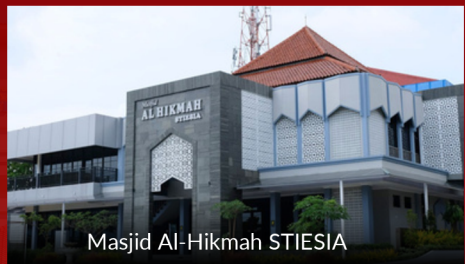
Masjid Al-Hikmah STIESIA