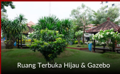
Ruang Terbuka Hijau & Gazebo