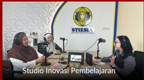
Studio Inovasi Pembelajaran