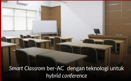
Smart Classroom ber-AC dengan teknologi untuk hybrid conference